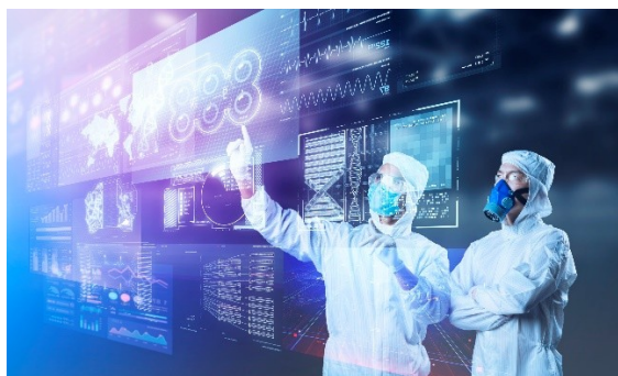
BU: Smart Factory-Lösungen für die Pharma-, Nahrungs- und Genussmittelindustrien